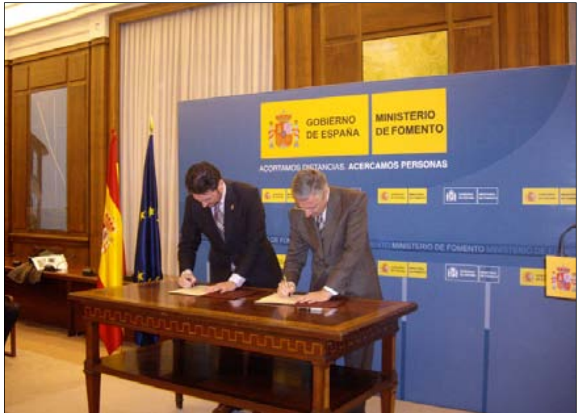
Un momento de la firma del acuerdo

La ejecución de esta actuación supondrá la movilización de 1,2