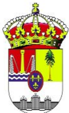
Ayuntamiento de San Ildefonso - La Granja

Estos centros tienen como finalidad la cooperación en el fomento del turismo en el ámbito de la actuación de cada uno de ellos, de acuerdo con la política turística de la Junta de Castilla y León.