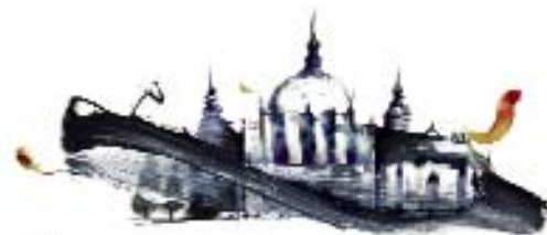
SAN ILDEFONSO - LA GRANJA Plan de Dinamización Turística