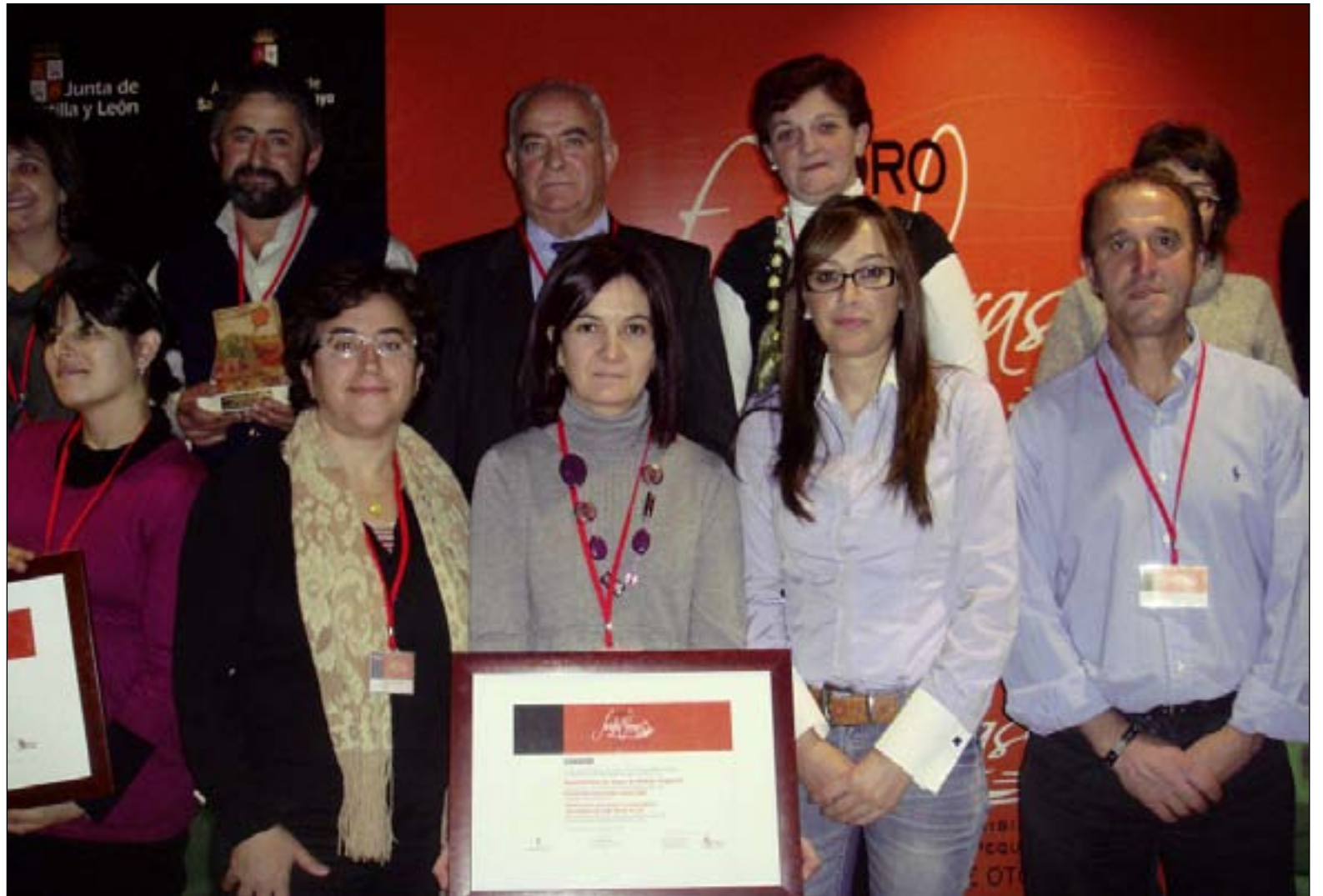
Los galardonados en el acto de entrega de los premios

El conjunto, rehabilitado en 2008 por el Ayuntamiento con la colaboración de Segovia Sur, es hoy un punto turístico donde se puede conocer la historia de los caleros